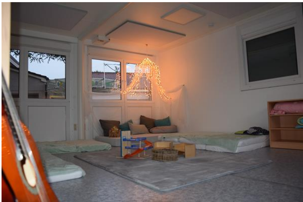
Schlaf- und Ruheraum