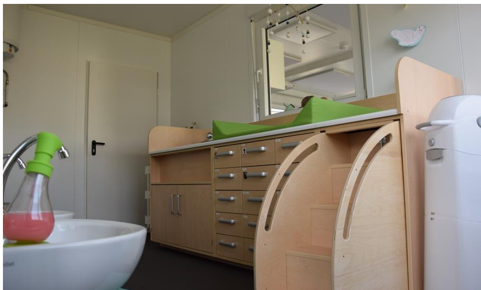
Sanitärraum mit Wickeltisch