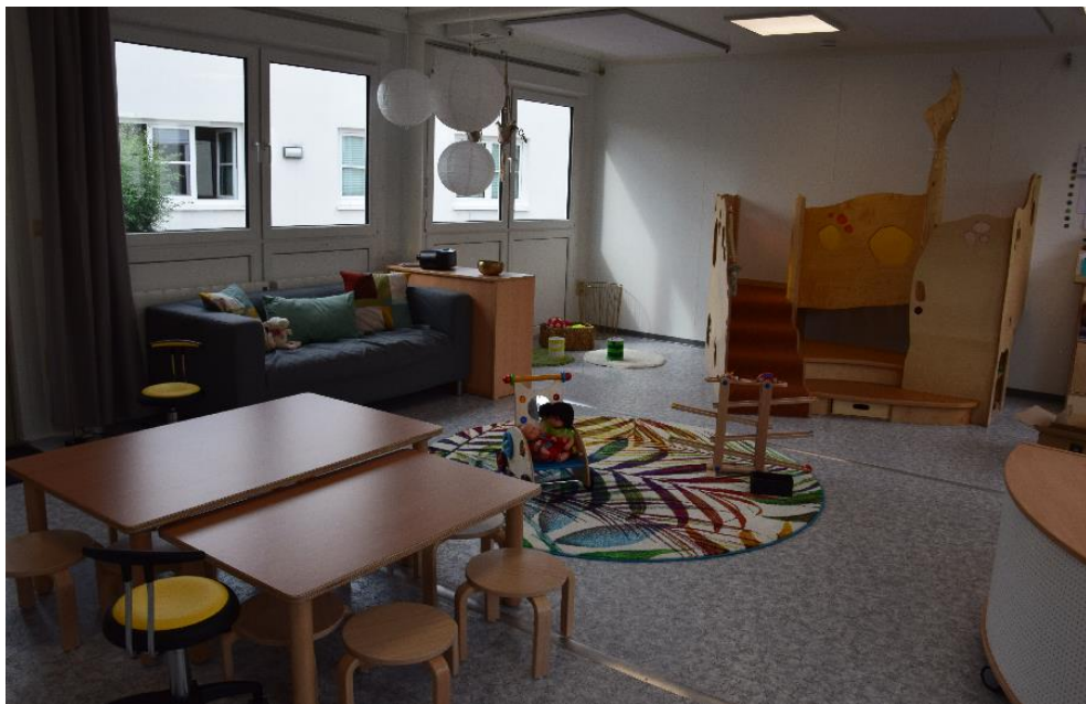
Blick in den Gruppenraum mit Hochebene